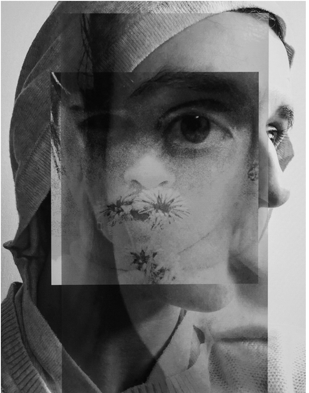
Maros Lili: Névtelen, 2023