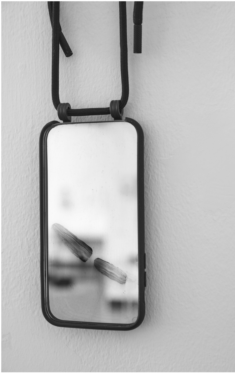
Zilahi Antal: Touch 10, 2022 (üvegcsizolás, ezüsttükör technika, üveg, 16x6x0,5 cm), készült: MOME