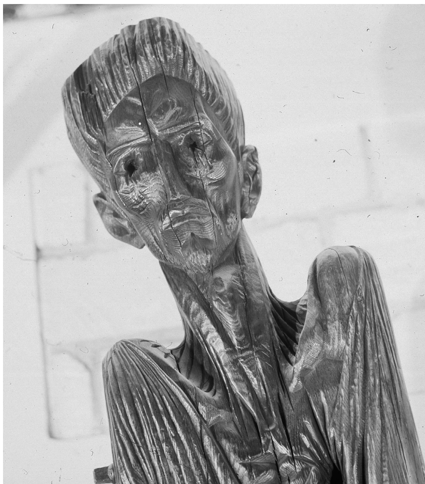
Szervátiusz Tibor: Petőfi Erdélyben című, égetett ecetfából készült, 1977-es szobrának részlete

a legnagyobb sikert. A Talpra magyar nélkül is az övé volna. Csak azért, mert ezt szabták rá, ez az egyszerre játékos és tragikus, nevető és forradalmi éghajlat felelt meg leginkább a természetének, legotthonosabban ebben mozgott, pontosan a hónap végéig, mert a csak játékos és köhögve is füttyös április persze már Csokonaié. Nem tudom pontosan, milyen más országokban március arca. Olaszországban, úgy láttam, a munka verejtékétől piros. Nálunk attól a láztól, amely Petőfi arcát tüzesítette, a remény és a szabadság szeleitől. Petőfinek köszönheti, hogy nálunk a szabadság hava immár mindörökre.” (Rádióelőadás: 1941)