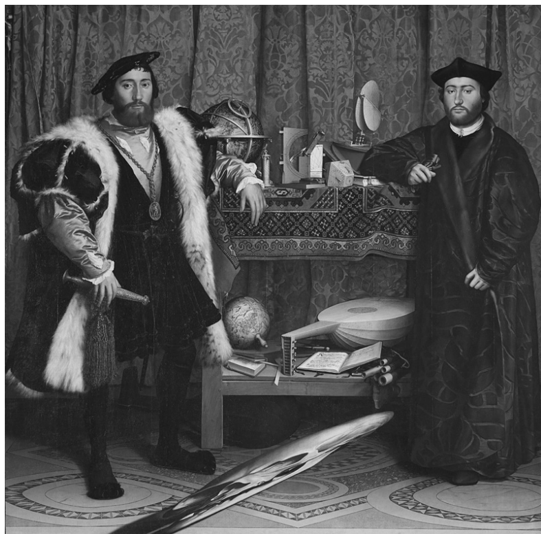
ffj. Hans Holbein: Követek (Jean de Dinteville and Georges de Selve) [olaj, vászon, 207×209,5 cm, 1533. National Gallery, London]

Magyarázzam-e, hogy a Commedia három részének emblémáját látom bennük. A koponya természetesen a Pokol, az alsó polc glóbusza a Purgatórium, a felső polc éggömbje pedig a Paradicsom. Ha „szerepjátszó” képnek képzelném a festményt, a szereplők egyikébe Jean de Dinteville francia követbe Dantét, a másikba, Georges de Selve-be, aki követ és püspök volt egy személyben, Vergiliust kellene belelátnom. Az alsó polcon, a földgömb mellé tett eszközök (könyv, lant, fuvola) a művészetekkel, általában a földi élet hívságaival kapcsolatosak. A Purgatóriumot is ugyanez jellemzi – különösen a gögnek szentelt három purgatóriumi éneket (X, XI, XII). A kevélység, a hiúság, a földi hírnév utáni áhítozás ugyanis legfőképp a művészek bűne. Itt esik szó a kor legjelentősebb