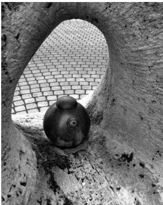
Ivókút. Hajdúszoboszló, 1995

utolsó pillanatokat mint bármit ami már visszatartthatatlan